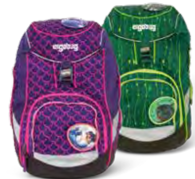
Schulrucksäcke mit fluoreszierenden Farben leuchten auf, wenn Licht darauf fällt.

Für Kinder ist der Ranzen sehr wichtig, viele lieben ihn regelrecht. Für die Mütter und Väter spielt neben praktischen Überlegungen auch die Sicherheit eine große Rolle.