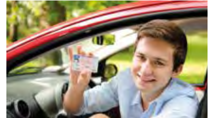
Verkehrssicherheit geht uns alle an!