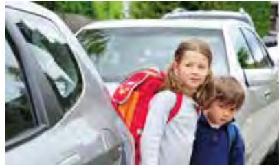
Jeder von uns ist Verkehrsteilnehmer/in.