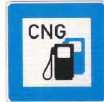
Zeichen 385-54 Erdgastankstelle