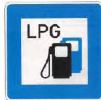
Zeichen 385-53 Autogastankstelle